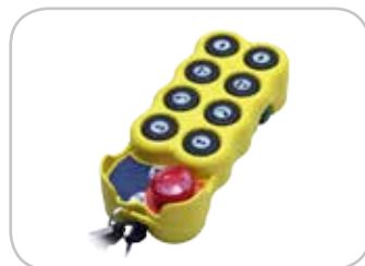
Versioni con radiocomando (accensione/spengimento, On/Off by-pass, regolazione giri motore, avvolgimento/svolgimento su versioni con naspo idraulico)

Versions with radio-control (on/off. On/off bypass, motor rpm adjustment, winding/unwinding on versions with hydraulic hose reel)