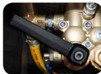
Versioni con sistema Pulse ideale per disotturazione, scarichi/tubature.

Versions with Pulse system ideal for unblocking drains/pipes