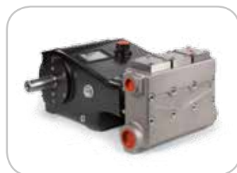
Pompa HPP ELS su 75/210, 84/190 e 102/150.

HPP ELS pump on 75/210, 84/190 and 102/150.