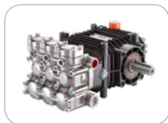
Pompa HPP CLW su 60/200 e 75/150.