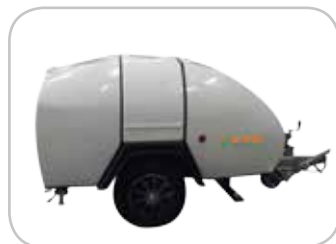
Cofanatura in fibra di vetro.