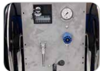
Versioni Basic con valvola on/off e regolatore di giri manuale.

Versions with Pulse system ideal for unblocking drains/pipes