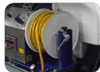
Naspo bassa pressione manuale: - 50 mt tubo 3/4"

Fixed hydraulic HP hose reel + Guide Max 100 m 1/2" hose - 60 m 3/4"